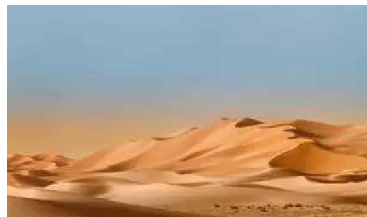
Les Dunes de sable