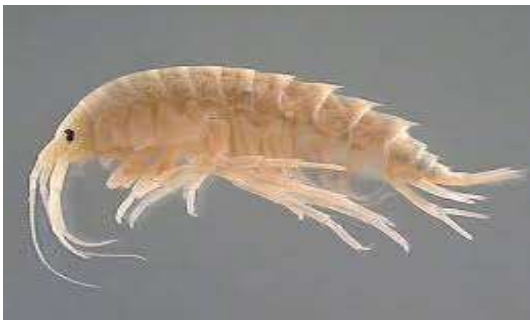
Les crevettes remplaceront les dattes à Ouargla - Hassi Ben Abdallah