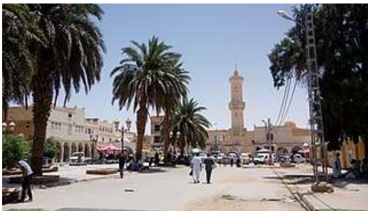
Le centre du ksar (Centre du Casbah)