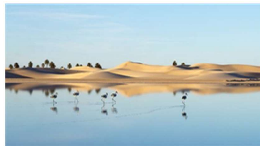
Le lac de Hassi Ben Abdallah